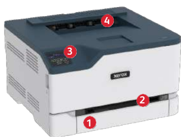
Imprimante couleur Xerox® C230