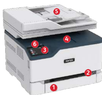
Imprimante multifonction couleur Xerox® C235